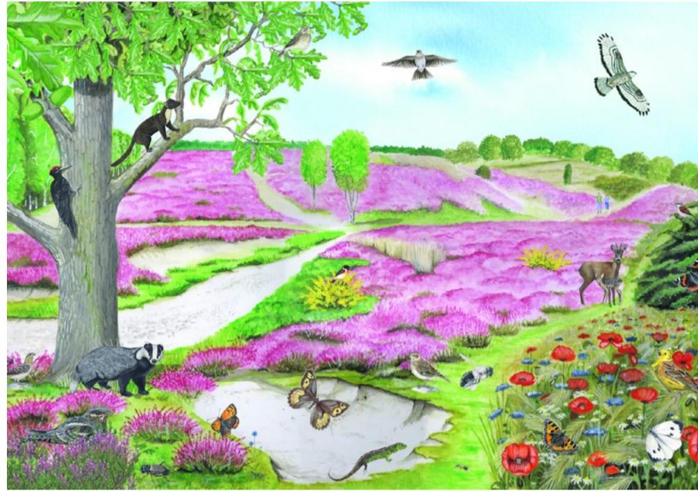
Zo kan in de toekomst het Land van Peelen eruit zien. Artist impression Jasper Jan de Ruiter.

'Het is een ingewikkeld traject', legt Baars uit. 'We zijn afhankelijk van de medewerking van de eigenaar. Die wil inmiddels wel weg. Dat positieve