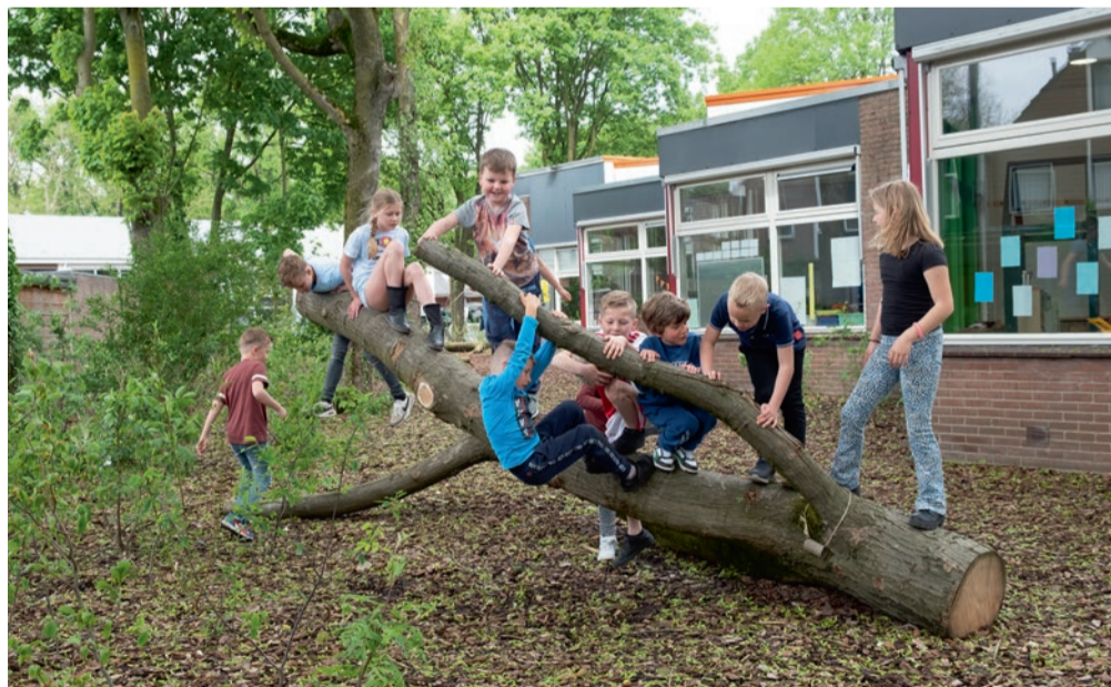
Natuurbeleving begint met de verwondering van een kind.

klauteren, schommelen, rennen ... Maar dan wel op een groen speelplein. Ruepert leidt rond: 'Daar is de waterbaan die uitmondt in een modderbad. Dat bad is goed voor de metselbijen. We hebben speciaal boomstronken laten liggen, dat zijn natuurlijke klimobjecten. Binnenkort gaan we oesterzwammen kweken op kleine boomstammetjes. Die oogsten en bereiden we samen. Tegels zijn vervangen door boomschors. Buitenspelen is met al die natuurlijke