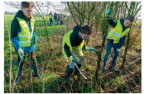
De houtsingel krijgt een opknapbeurt.

De leerlingen gaan aan de slag in groepjes van drie. De ene helft begint met de houtwal en de andere helft buigt zich over de uitgezette quiz van IVN Natuureducatie met allerlei leuke vragen over bomen. Na de pauze wisselen de groepen om. Het plezier spat ervan af en ondertussen steken de leerlingen het nodige op. De Boomfeestdag is voor de school jaarlijks een geliefd uitje. Toen het in coronatijd een keer niet doorging, waren de kinderen erg teleurgesteld.