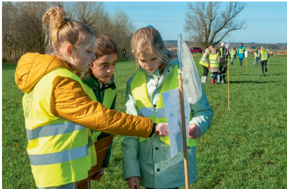
Onderdeel van de Boomfeestdag was een leuke quiz met vragen over bomen.

Op een zeil ligt het gereedschap klaar. 'We hebben prachtige zagen, maar pas op, ze zijn héél scherp. Dus niet ermee rondzwaaien of naar anderen wijzen.' Ondertussen doet Vloedgraven voor hoe je een tak zaagt. De kinderen staan