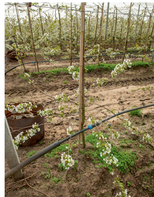
De kersen worden onder doek geteeld, een goede bescherming tegen kou, regen, hagel en vrachtschade.

Inmiddels is het tijd om kersen te proeven. Dus op naar de Veluwe Aspergeboerderij.