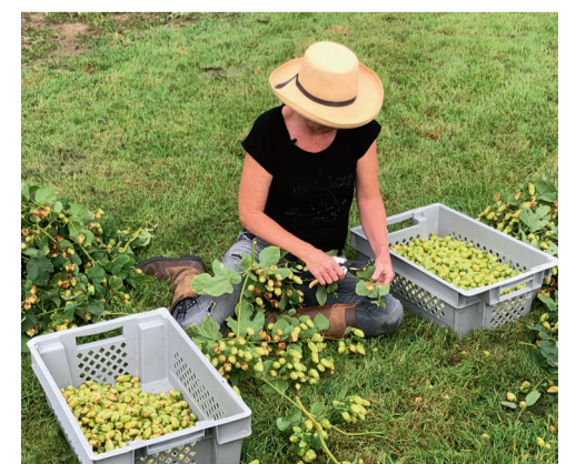
Meer informatie: www.alleehop.nl