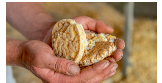
Reststromen uit de foodindustrie als voedsel voor de kalveren.

En hun klanten? 'Het gaat hen om de kwaliteit van het vlees en hoe we met onze dieren omgaan.'