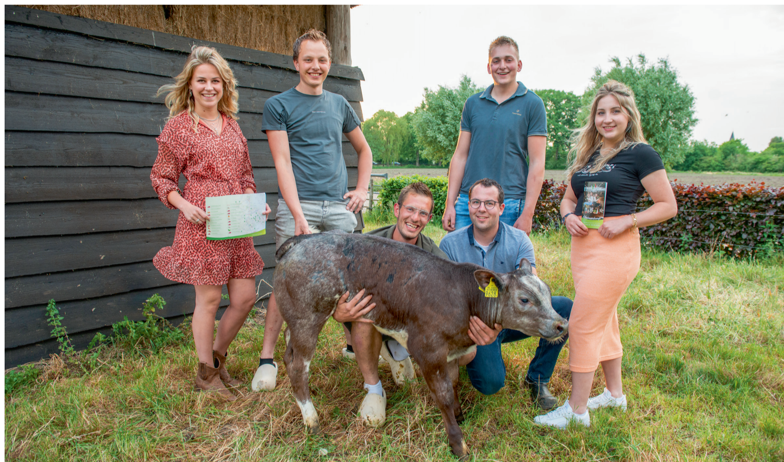
Het bestuur van AJK Stroe Wekerom stimuleert huisverkoop van lokale producten.

De activiteiten van AJK Stroe Wekerom lagen door corona ineens stil. De informatieavonden en de jaarlijkse excursie van de belangenvereniging van jonge boeren gingen niet door. Van stilzitten wilde het bestuur niets weten. Ze bedachten een promotieactie voor erfverkoop. Met twee fietsroutes, een flyeractie en een magazine brengen ze boer en burger bij elkaar onder het motto: 'Wees loyaal, koop lokaal'.